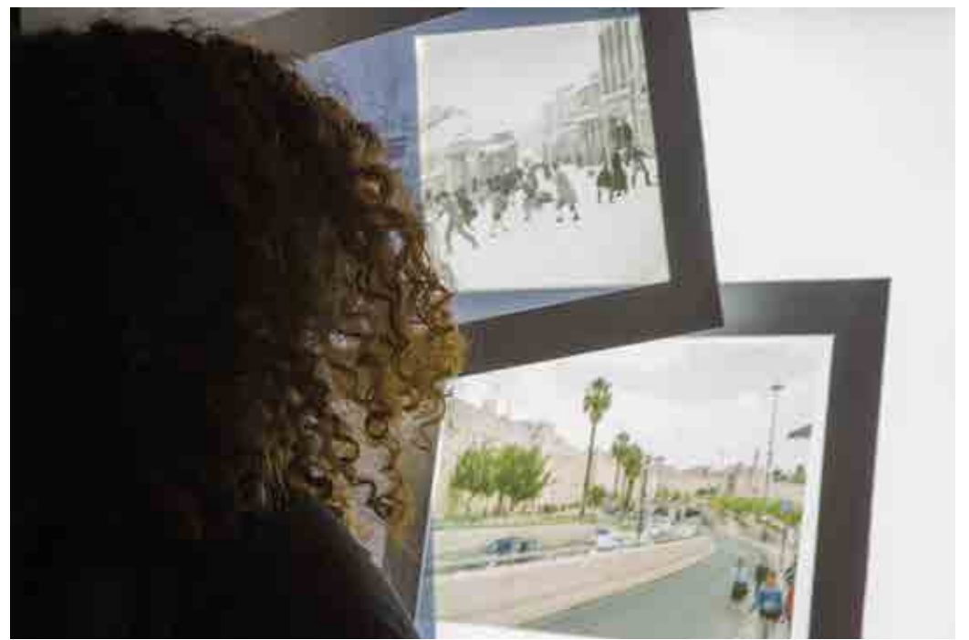
Jack Persekian, 'Jaffa Gate and Mamilla', 2018, photo-overlays

Nog een beperking: het gebrek aan middelen voor transport of verzekeringen. In Ramallah