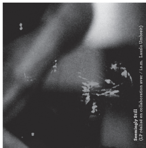
Seemingly Still (LP réalisé en collaboration avec / i.s.m. Laszlo Umbreit)